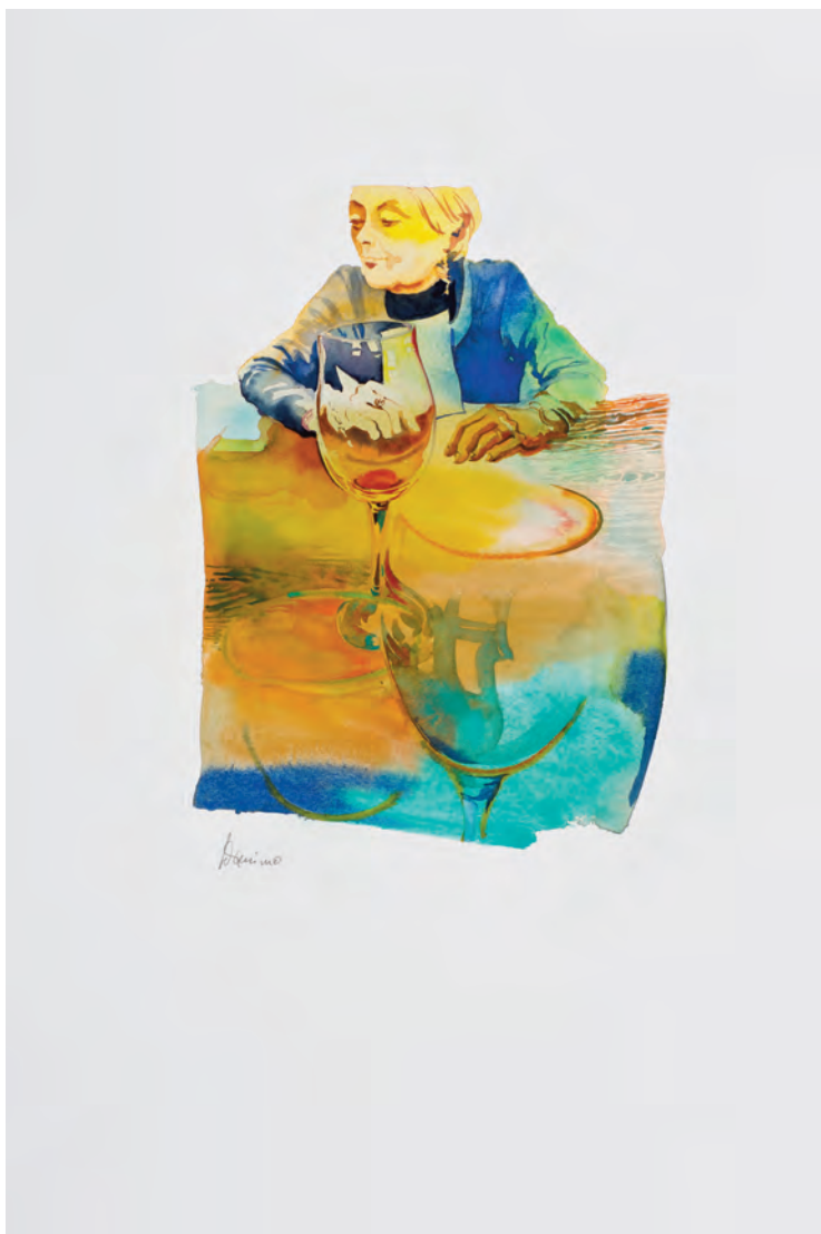
la persona di fronte