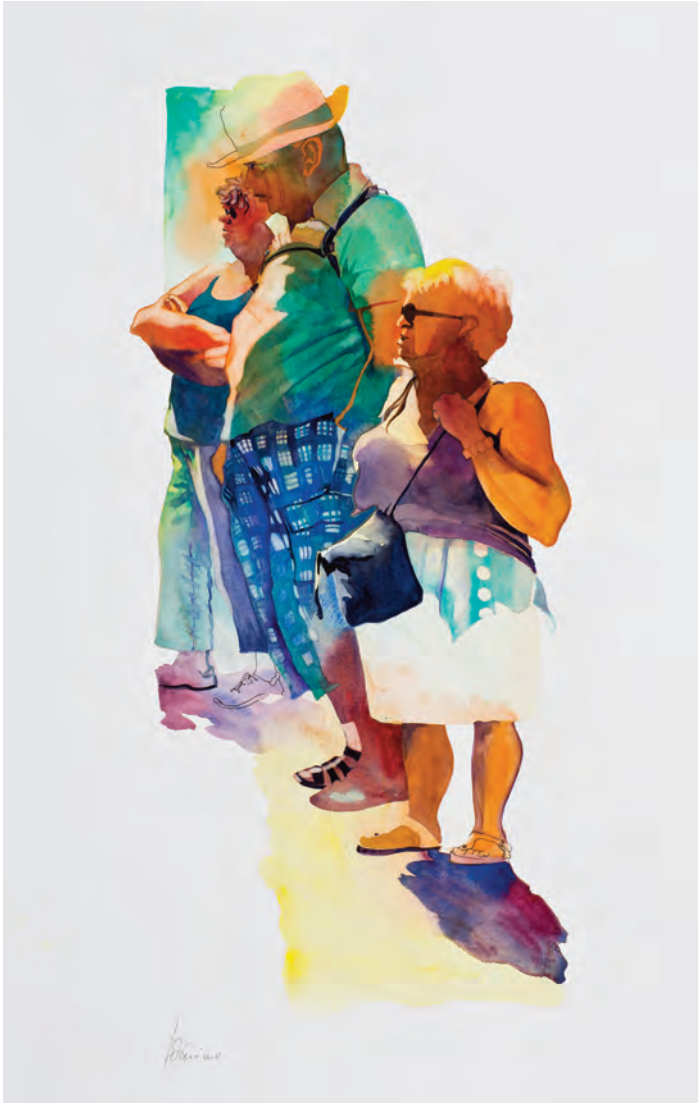
bermuda quadrettati olandesi