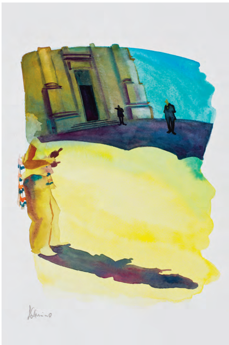
glauben, macht und sinnlichkeit/i tre seduttori