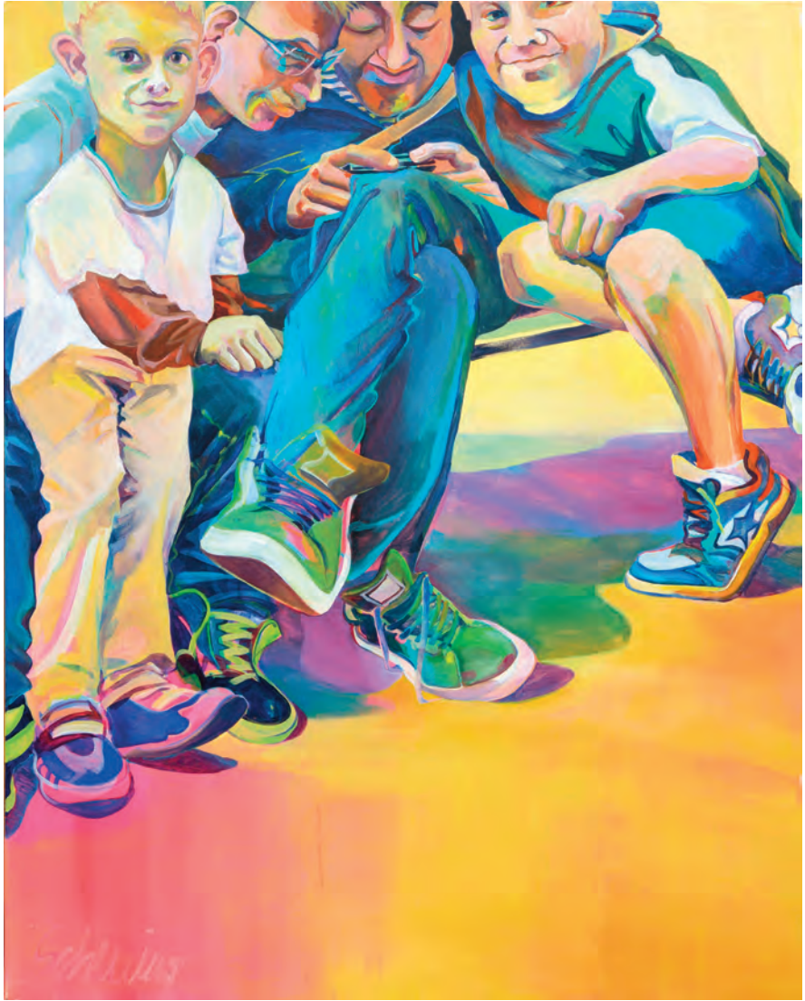
i miei ragazzi di moncalvo