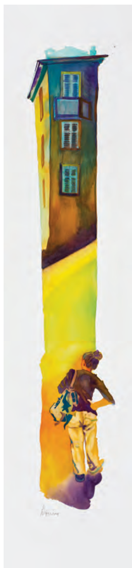
la degustazione di vignale