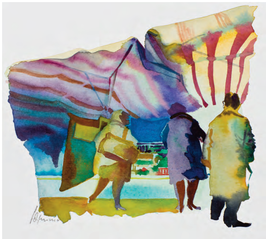
la fuga a casale