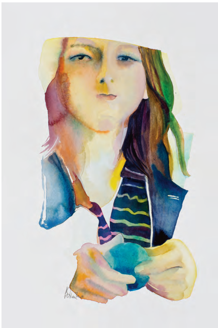
der ernste blick / l'occhiata