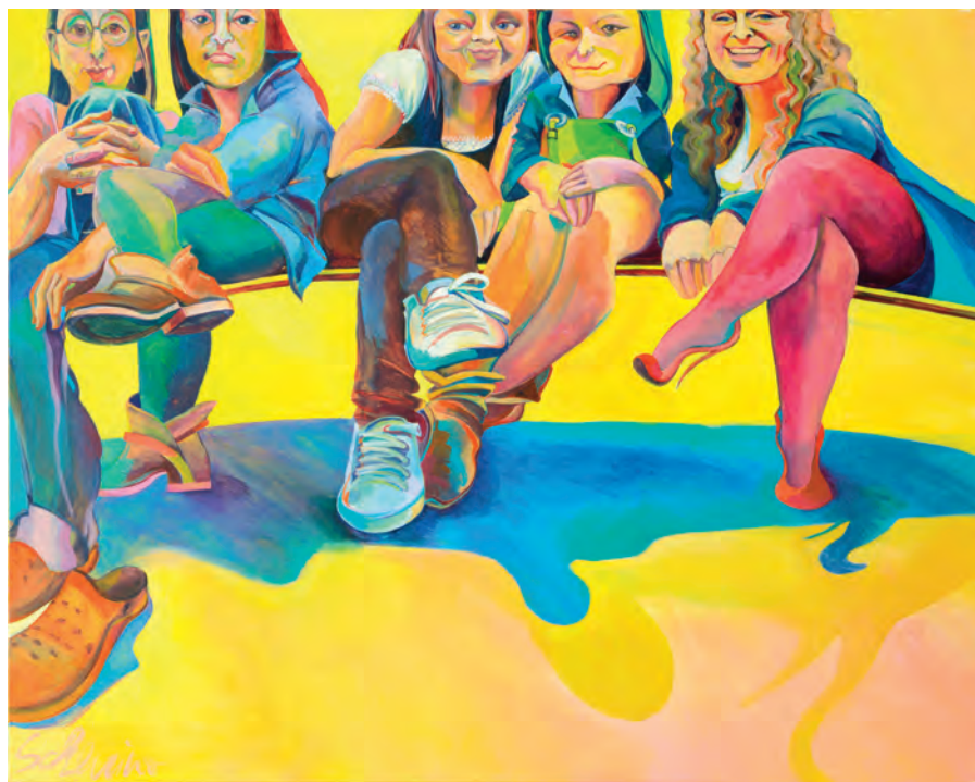
le cinque bellezze di asti