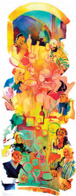
la grande cena