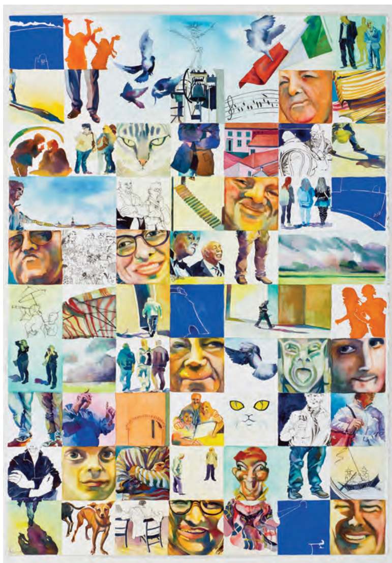
settanta impressioni dell'avvicinamento