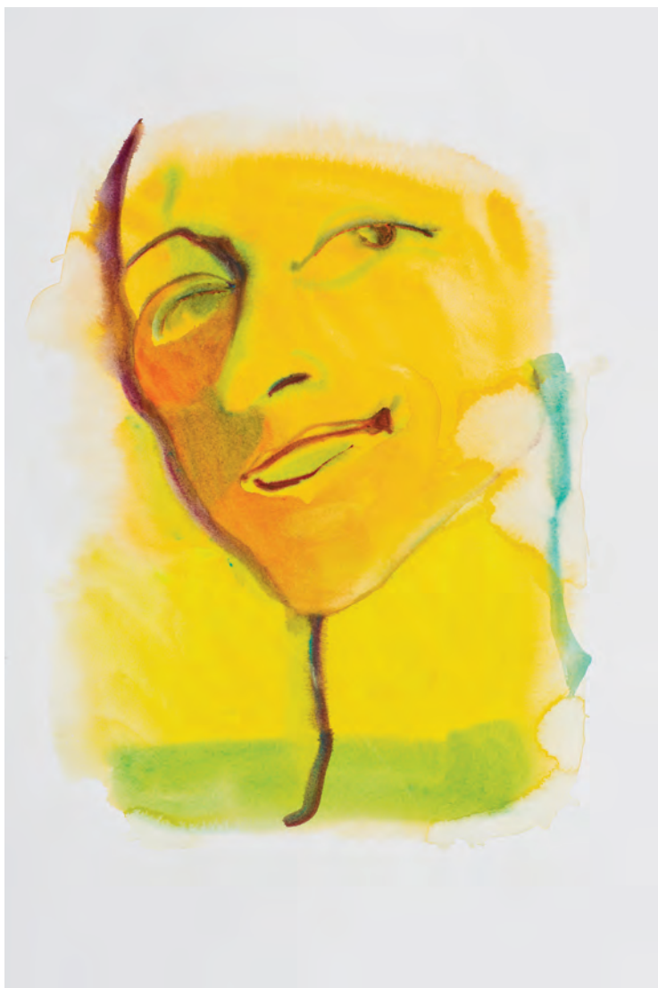
lachelne dame / sta bene